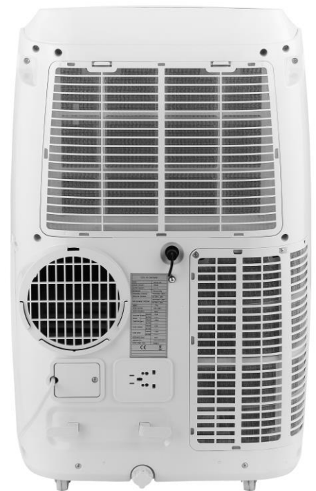
Abluftschlauchanschluss 150 mm Schlauchdurchmesser