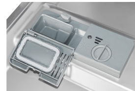
Dosiereinheit Genauere Dosierung des Spülmittels