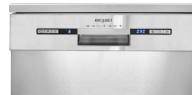
Bedienung Bedienpanel mit Restlaufanzeige