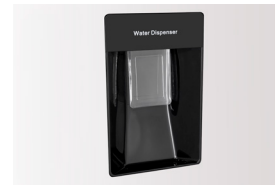
Wasserspender Jederzeit bequem gekühltes Wasser entnehmen