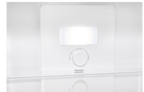
No-Frost-Technik Sorgt dafür, dass das Gerät nie wieder abgetaut werden muss