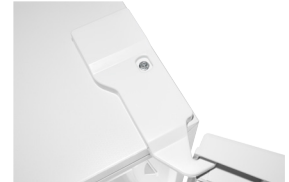
Wechselbarer Türanschlag So passt das Gerät in die kleinste Küche – ganz genau so, wie Sie es möchten