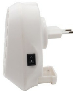
Seitenansicht - Insektenfach