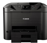
MAXIFY MB5450 Modelle