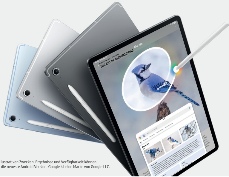
Bild simuliert. Benutzeroberfläche kann abweichen. Nur zu illustrativen Zwecken. Ergebnisse und Verfügbarkeit können variieren. Erfordert Internetverbindung und möglicherweise die neueste Android Version. Google ist eine Marke von Google LLC.