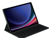
Book Cover Keyboard Slim (AI Key)