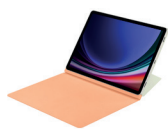
Book Cover Keyboard (AI Key)