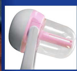
Rotazione di 180°