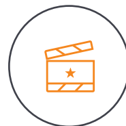
Einfache Tutorials & One-Tap-Editing