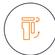
Tragbar & faltbar