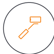
Integrierter 215 mm- Verlängerungsstab