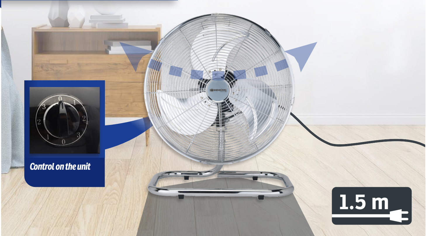
Control on the unit