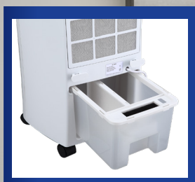
Rimovibile Serbatoio dell'acqua con 6 l