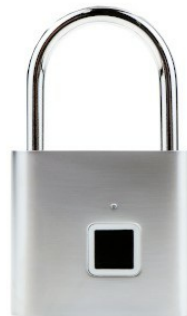
Frontansicht im Standby