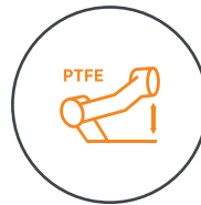
Teflon™ verbessertes Balancieren