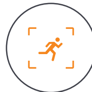
Intelligente Verfolgung und Komposition