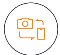
Geeignet für Kameras und Smartphones