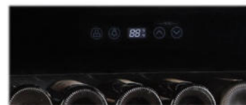
Elektronische Temperatur Einstellung