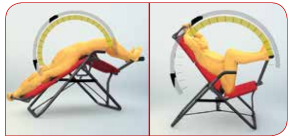
Effektive Rückenstreckung und Aufbautraining einfach im Sitzen