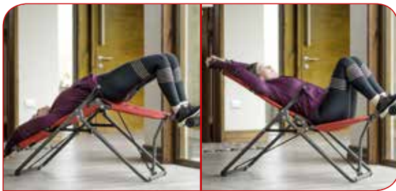
Inversionsbank für Ganzkörpertraining sowie Streckung der Wirbelsäule