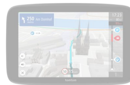
GO Navigator 2. Generation