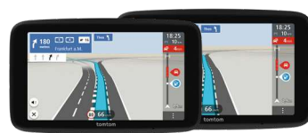
GO Classic 2. Generation

Das TomTom GO Classic der zweiten Generation ist Ihr kostengünstiger Navigationspartner mit hochwertigen TomTom-Karten (inklusive Updates für Europa) und zuverlässigem TomTom Traffic. Das GO Classic umfasst jetzt monatliche Karten-Updates, 3 Routenoptionen, einen dynamischen Fahrspurassistenten und einen USB-C-Anschluss (Branchenstandard). Verglichen mit der vorherigen Generation bietet der interaktive Touchscreen jetzt eine noch höhere Auflösung und Qualität, damit Sie keine Abbiegung oder Warnung mehr verpassen. Das GO Classic ist ein umfassendes TomTom-Pkw-Navi zu einem kostengünstigen Preis.