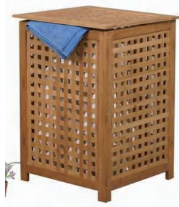
Bambus Wäschebox (88941931-64341546)